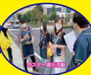
ポスター掲示活動